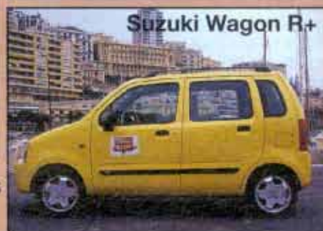
Suzuki Wagon R+

Hur mycket alkohol innehåller en burk öl ■