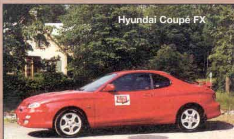
Hyundai Coupé FX