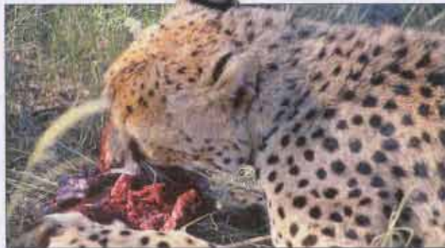
Fisch am Schild: Stilleben an der Skelettküste Wildnis pur: ein Gepard mit seiner Beute