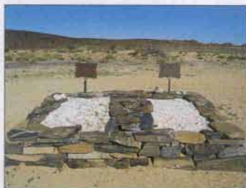
Zwei Gräber der einstigen deutschen Schutztruppe auf dem Weg nach Tinkas

Route zur Blutkuppe gewählt haben, um hier vielleicht mehr Tiere zu sehen. Die Blutkuppe ist ein weiterer Inselberg der Namib. Der Sage nach haben dort die Ureinwohner ihre besiegten Feinde hinuntergeworfen, sodass der Fels rot vom Blut getränkt gewesen sein soll. Die letzten 400 Kilometer Geröllpiste sind teilweise blankem Stein gewichen. Auf spitzem Schiefer sind zwei Spuren manchmal nur noch vage zu erkennen. Immer wieder muss der Beifahrer aussteigen und das Fahrzeug einweisen, damit der Bauch der Reifen nicht aufgeschnitten wird.