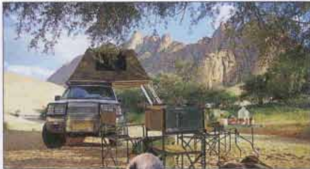
Selten und aggressiv: ein Rhino-Bulle (schwarzes Nashorn) Camp an der Spitzkoppe, dem „Südwest-Matterhorn“