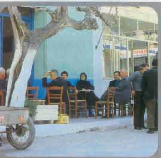
Beschaulich: Kreter dösend vorm Haus