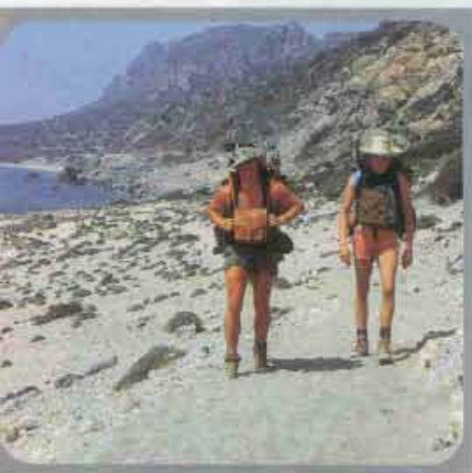
Mühsam: Der sandige Weg am Strand