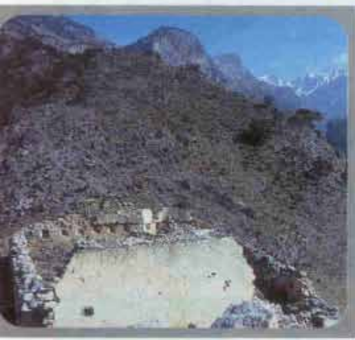
Idylle: Verfallener Stall in den Bergen

Vormittag geht mit der Wegsuche drauf, aber bis zur Quelle müssen wir unbedingt kommen, denn wir haben unser Wasser bereits verbraucht. Die Hitze ist unerträglich geworden. Kurze Hosen können wir nicht mehr tragen, das Stechginstergestrüpp ist zu dicht. Besser schwitzen als Haut lassen. Nur noch 500 Meter bis zur Quelle – Luftlinie und bergauf.