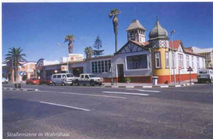
Straßenszene in Walvisbaai

An einem 1935 gestrandeten Schiffswrack vorbei quält sich unser Wagen durch den weichen Sand. Wenig später