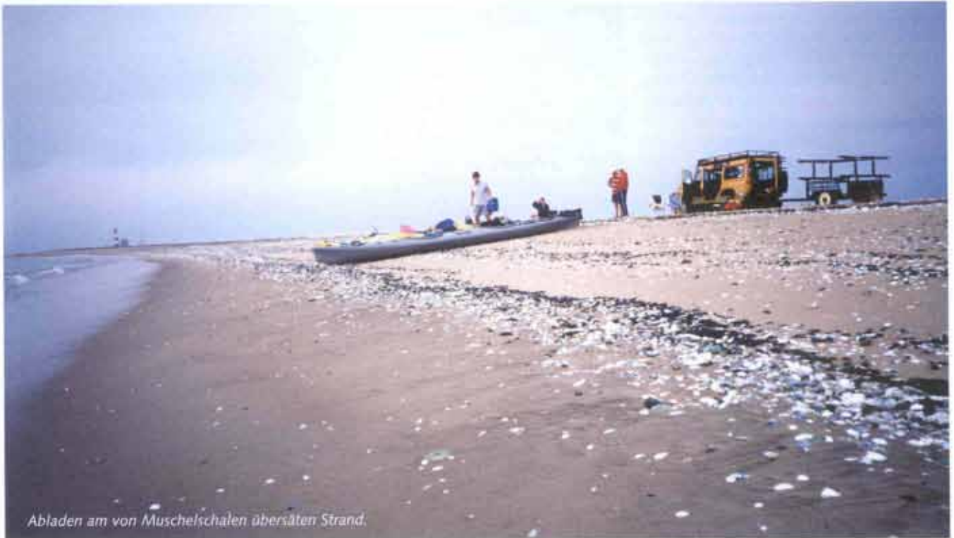
Abladen am von Muschelschalen übersäten Strand.

warten. Auch mit der Möglichkeit durch Support eines Landteams kommt bei ihr keine Begeisterung auf. Mir geht die Idee jedoch nicht aus dem Kopf. Das wäre doch einmal wieder was. Egal, ich lenke das Gespräch noch einmal auf die Pinguine, und sie erklärt, das der Jackass Penguin manchmal von den weiter südlich gelegenen Brutgebieten bis hier her migriert. Das wäre es gewesen, einen Pinguin habe ich noch nie in der freien Natur gesehen, aber wir sind alle auch so voll auf unsere Kosten gekommen.