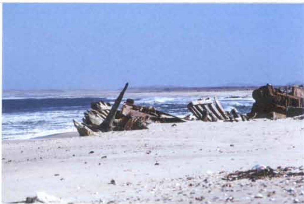
Angespültes Schiffswrack an der Küste.