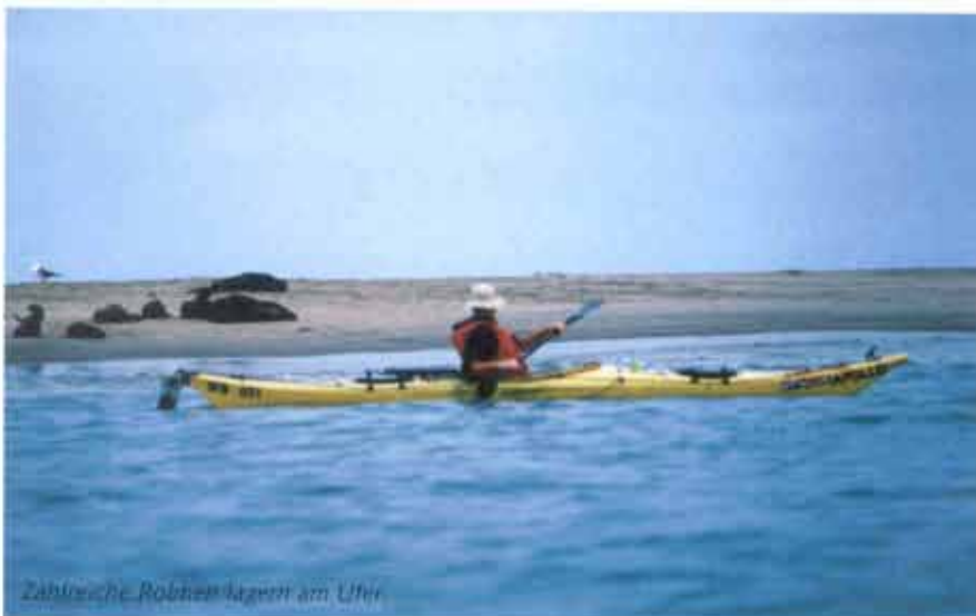
Zahlreiche Robben lagern am Ufer.