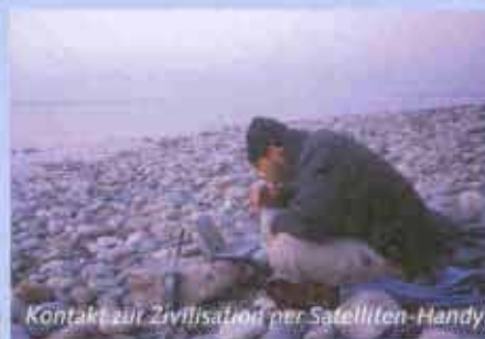
Kontakt zur Zivilisation per Satelliten-Handy.