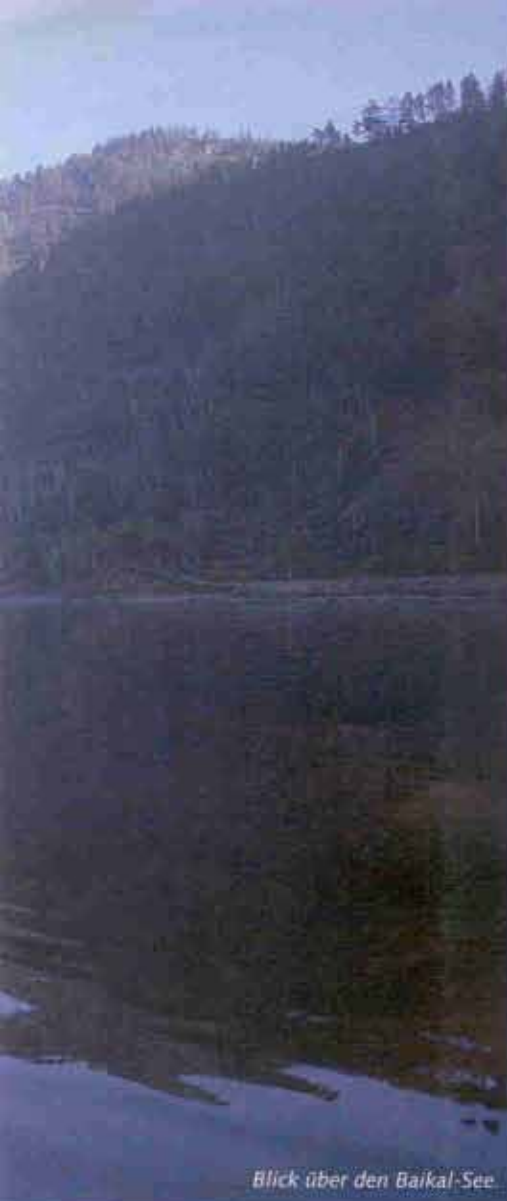
Blick über den Baikal-See.