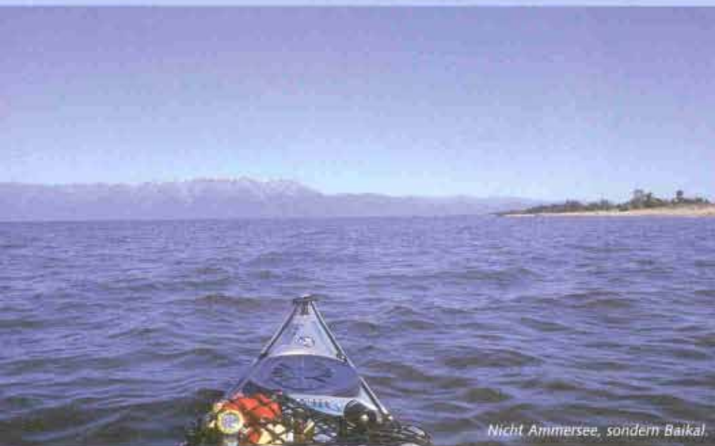
Nicht Ammersee, sondern Baikal.

Je weiter ich in den Norden komme, desto weniger und kleiner werden die Ortschaften, was sich auch durch mehr Wasservögel ankündigt. Massig Säger sind auf dem Wasser unterwegs, aber sie sind sehr scheu. Eine dicke Rostgans versucht mich von ihren Küken wegzulo-