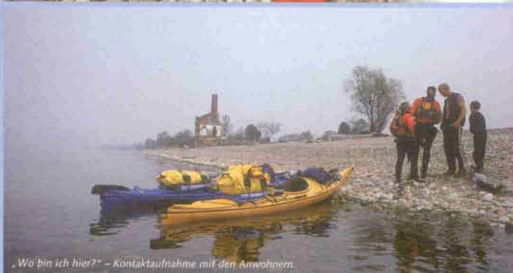
„Wo bin ich hier?“ – Kontaktaufnahme mit den Anwohnern.

ähneln. Die Jahresdurchschnittstemperatur liegt bei -1,7\text{ }^{\circ}\text{C} , lese ich in meinem Logbuch. Mitte Januar bis Ende April ist der See zugefroren. Der Winter ist charakterisiert durch extrem geringe Niederschläge.