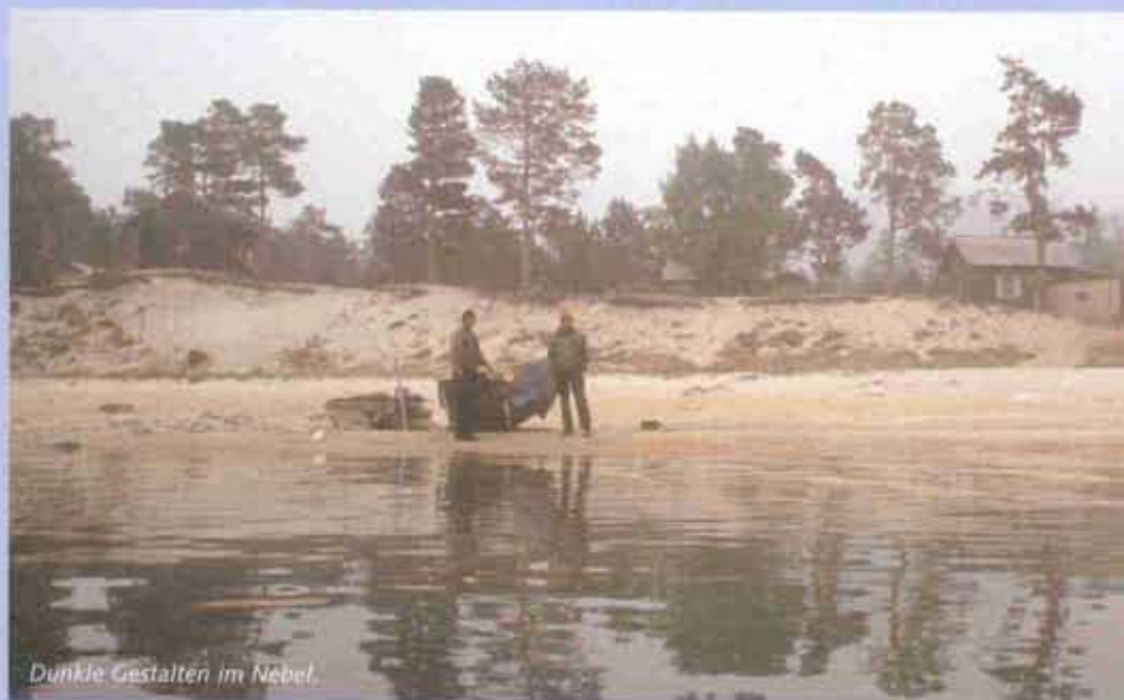
Dunkle Gestalten im Nebel

cken, indem sie trötend dicht vor mir die Welle macht und einen gebrochenen Flügel mimt. Ich habe zwar Hunger, aber heute kein Interesse an kross gebratenen Gänseküken.