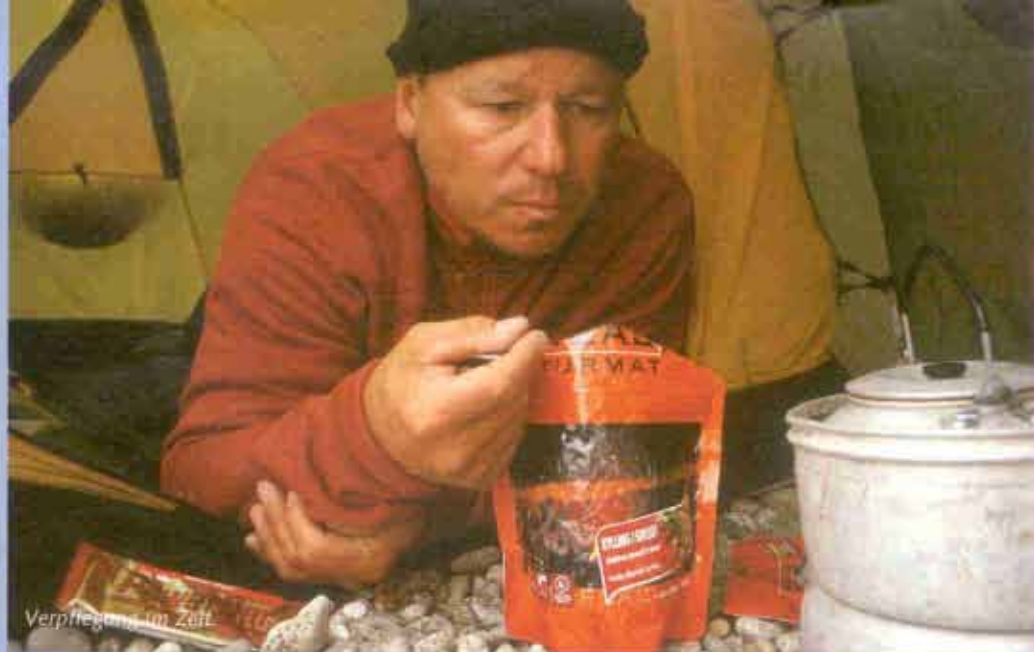
Verpögen in Zeit