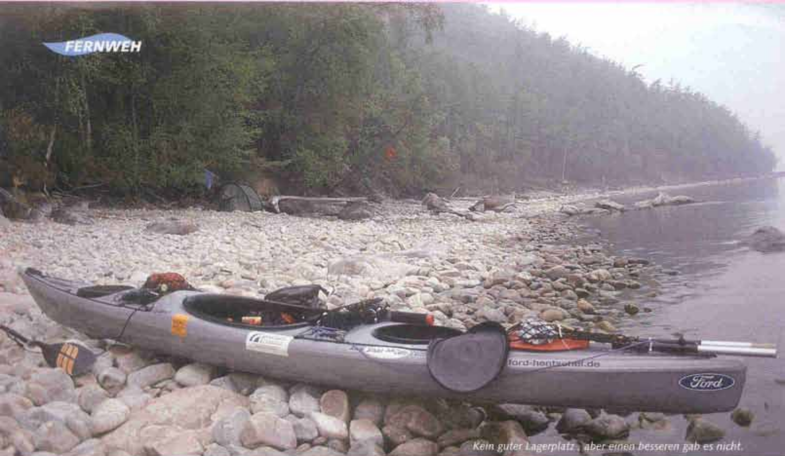
Kein guter Lagerplatz, aber einen besseren gab es nicht.

nicht tapen, denn die Salbe reicht vielleicht zu gut.